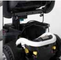
EXCEL E-SMART | FOTO 11