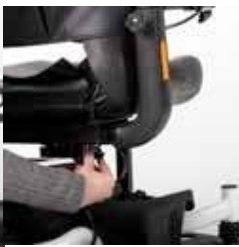
ExCEl E-SMART | FOTO 6