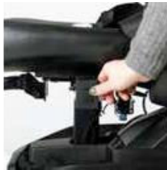
ExCEl E-SMART | FOTO 16