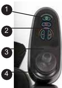
EXCEL E-SMART | FOTO 1

Ihr Elektrorollstuhl ist mit einem Joystick ausgestattet, wie auf Foto 1 dargestellt. Der Joystick kann in der Tiefe eingestellt werden. Dies kann durch Lösen des schwarzen Schraubknopfes an der Unterseite der Armlehne erfolgen (Foto 2). Schieben Sie als nächstes das Rohr mit dem Joystick nach hinten oder nach vorne. Wenn sich der Joystick in der gewünschten Position befindet, ziehen Sie den schwarzen Schraubknopf fest.