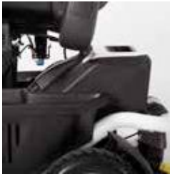
EXCEL E-SMART | FOTO 9

Der Akku (Foto 9) des Excel E-Smart kann entfernt werden. Unter dem Griff des Akkupacks befindet sich ein Knopf mit der Aufschrift "Push". Durch Drücken dieser Taste und gleichzeitigem Ziehen am Griff kann der Batteriepack herausgehoben und entfernt werden (Foto 10). Auf diese Weise können Sie den Akku unabhängig vom Rollstuhl überall aufladen, wo er weniger Platz benötigt. Der Ladeanschluss ist auf Foto 12 dargestellt.