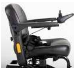
ExCEl E-SMART | FOTO 3