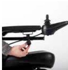
EXCEL E-SMART | FOTO 2