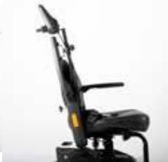
ExCEl E-SMART | FOTO 4

Die Armlehnen des Excel E-Smart können auch in der Höhe verstellt und komplett entfernt werden. Um die Höhe der Armlehnen einzustellen, lösen Sie den schwarzen Schraubknopf auf der Rückseite der Armlehne. Sie können die Armlehne jetzt auf die gewünschte Höhe heben oder senken. Ziehen Sie den Schraubknopf fest, um die Armlehne zu arretieren.