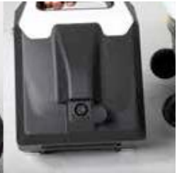
EXCEL E-SMART | FOTO 12