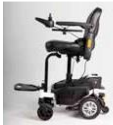
ExCEl E-SMART | FOTO 17