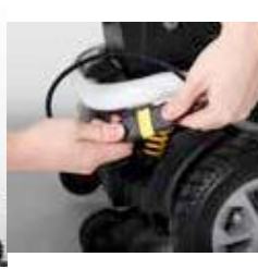
ExCEl E-SMART | FOTO 7