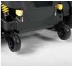
EXCEl E-SMART | FOTO 21

Der Excel E-Smart ist mit Kippschutzrädern ausgestattet. Diese sind an der Rückseite des Elektrorollstuhls angebracht. Die Anti-Kippräder bewegen sich mit der Oberfläche von Hindernissen, auf die Sie stoßen, und sorgen für eine sanftere und sicherere Fahrt.