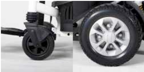
EXCEI E-SMART | FOTO 23

Die Vorderräder des Elektrorollstuhls haben einen Durchmesser von 6 Zoll und sind durch eine Vordergabel am Rahmen befestigt (Foto 23). Die Vorderräder sind wichtig beim Lenken des Rollstuhls. Wenn sie sich nicht gleichmäßig drehen oder bewegen oder wenn sie vibrieren, sind sie nicht richtig eingestellt.