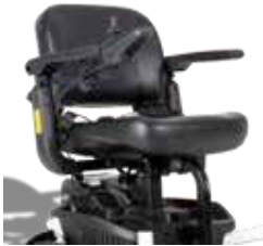
EXCEI E-SMART | FOTO 22

Der Sitz des Elektrorollstuhls (Foto 22) besteht aus angenehmem Schaumstoff und PU? Material. Dies macht es geeignet, länger im Elektrorollstuhl zu sitzen. Die Polsterung des Stuhls kann nicht entfernt werden. Der Sitz ist serienmäßig mit einem Sicherheitsgurt ausgestattet und kann zusammengeklappt werden. Außerdem kann der Sitz vollständig entfernt werden. Wie dies zu tun ist, wird in Abschnitt 7.1 beschrieben.