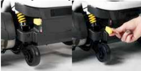
ExCEl E-SMART | FOTO 13

Der Excel E-Smart hat zwei Einstellungen, nämlich "neutral" und "drive" (Foto 13). Der Aufkleber neben den Freilaufhebeln zeigt diese beiden Einstellungen mit einem D für den Antrieb und einem N für neutral an. Wenn Sie den Elektrorollstuhl benutzen möchten, sollten diese Hebel immer auf die Fahrstufe eingestellt sein. Die Neutral- oder Freilaufeinstellung ermöglicht das Bewegen des Rollstuhls bei ausgeschalteter Steuerung. Wenn der Rollstuhl im Leerlauf nach vorne geschoben wird, fungiert der Motor als Generator. Um den Rollstuhl in den Freilaufmodus zu bringen, drücken Sie beide Hebel nach oben. Drücken Sie beide Hebel wieder nach unten, um sie wieder in den Antrieb zu bringen. Dadurch werden die elektromagnetischen Bremsen wieder aktiviert, sodass der Rollstuhl nicht bewegt werden kann, wenn er nicht wie gewohnt eingeschaltet und gesteuert wird.