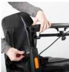
ExCEl E-SMART | FOTO 5

Die Armlehnen des Excel E-Smart können auch in der Höhe verstellt und komplett entfernt werden. Um die Höhe der Armlehnen einzustellen, lösen Sie den schwarzen Schraubknopf auf der Rückseite der Armlehne. Sie können die Armlehne jetzt auf die gewünschte Höhe heben oder senken. Ziehen Sie den Schraubknopf fest, um die Armlehne zu arretieren.