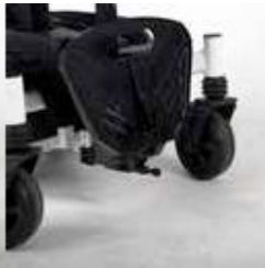
ExCEl E-SMART | FOTO 26