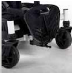
EXCEl E-SMART | FOTO 20

Die Fußplatte kann auch in der Höhe verstellt werden. Sie können dies tun, indem Sie die schwarzen Schrauben und Muttern lösen und entfernen. Jetzt können Sie die Fußplatte auf die gewünschte Höhe bewegen. Um die Fußplatte zu fixieren, setzen Sie die schwarzen Muttern und Schrauben zurück und ziehen Sie sie fest.