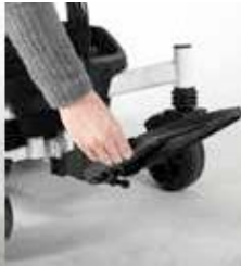
EXCEl E-SMART | FOTO 19