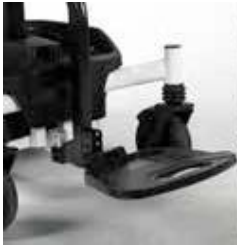
EXCEl E-SMART | FOTO 18