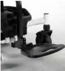
ExCEl E-SMART | FOTO 25