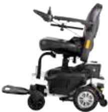
ExCEl E-SMART | FOTO 15

Der Excel E-Smart + ist mit einem High-Low-System ausgestattet. Dies ist ein elektrisches System, das den Zugang zu höheren Objekten wie Küchenschränken erleichtert. Auf Foto 15 sehen Sie den Excel E-Smart + in der untersten Position. Durch Drücken der Taste unter der linken Seite des Sitzes (Foto 16). Foto 17 zeigt die höchste Position des E-Smart +. Sie können den Rollstuhl nur fahren, wenn sich der Sitz in der niedrigsten Position befindet.