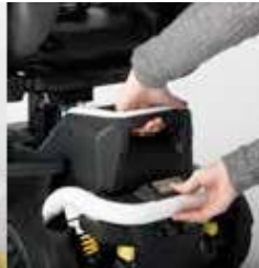
EXCEL E-SMART | FOTO 10