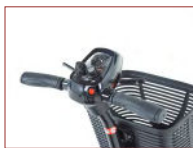
Weicher Griff und zwei Bedienelemente