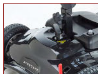
T-Bar-Griff mit Schnellverschluss