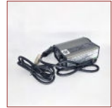
Ladegerät im Auto