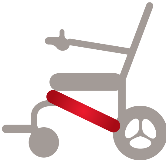
Position Akku ergoflix® L und LX