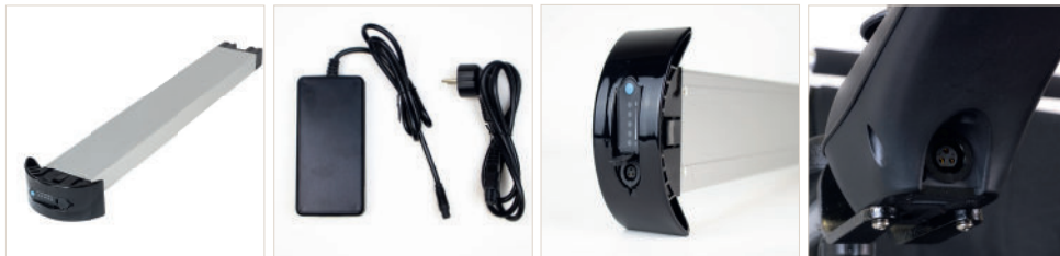
Abbildung 1: Akku des ergoflix®L und LX mit dem dazugehörigen Ladegerät und Anschlüssen