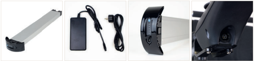
Abbildung 1: Akku des JBH® Carbon 21, dem dazugehörigen Ladegerät und Anschlüssen